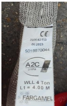
L'étiquette d'identification de l'élingue

Comment vérifier la conformité des élingues A2C, pour cela vous allez devoir vérifier l'accessoire afin de trouver 2 éléments :